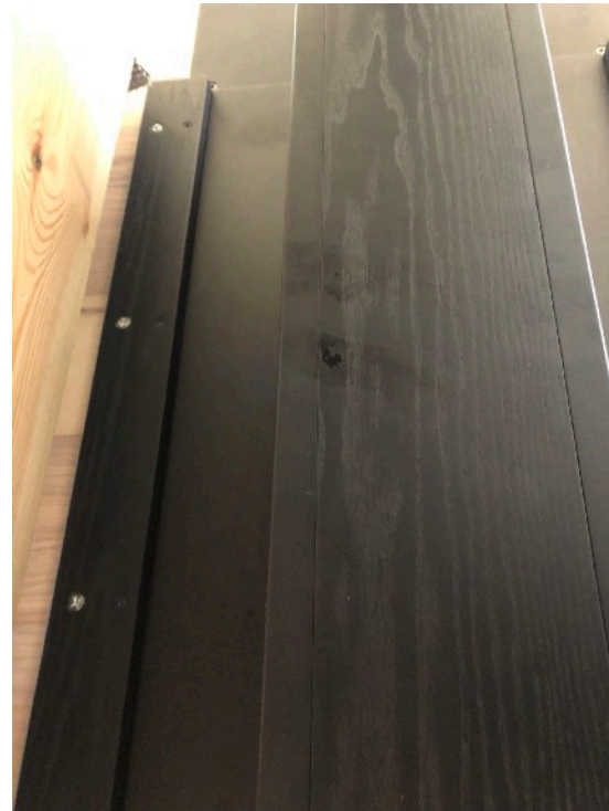
ANVÄND BITS FÖR ATT SKRUVA FAST MITTPARTI MED FÖRSTA SIDOSKIVAN