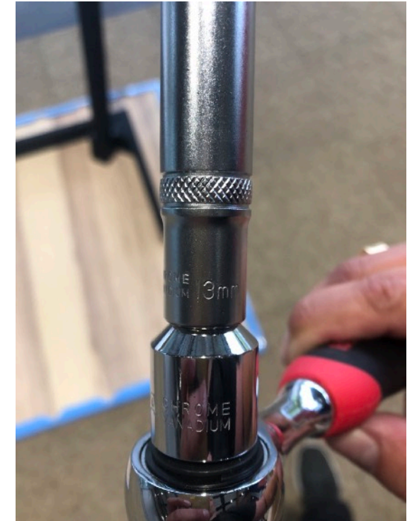
ANVÄND HYLSA 13 MM FÖR ATT DRA ÅT VARJE BEN