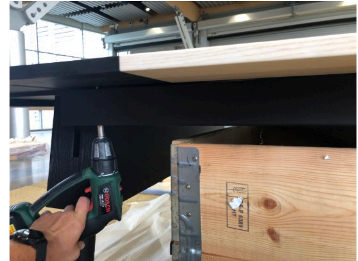
3 ST SKRUVAR FÖR VARJE SIDOBALK