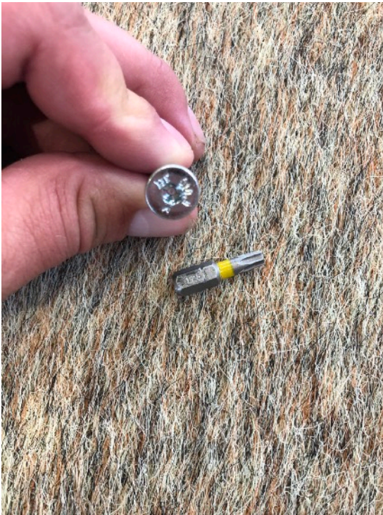
ANVÄND PAKET 2 INNEHÅLLANDE 10 ST SKRUVAR