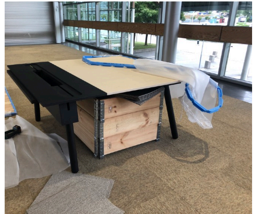
BILD EFTER ATT DE FÖRSTA 5 SKRUVARNA ÄR ISKRUVADE MELLAN MITTPARTI OCH SIDOSKIVA. LÄGG DÄREFTER PÅ SIDOSKIVA TVÅ FÖR ATT MONTERA DE SISTA 5 SKRIVARNA