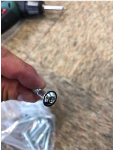
PAKET 3 INNEHÅLLANDE 12 ST SKRUVAR