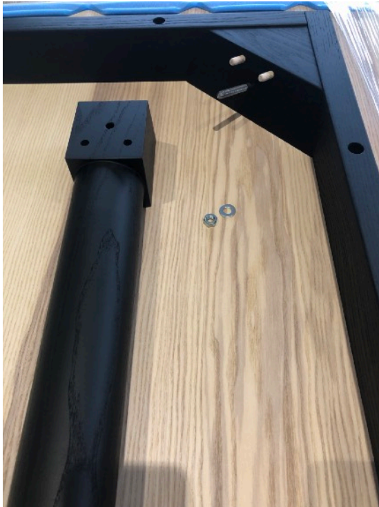
ANVÄND DETTA FÖR MONTERING FÖR ETT BEN

PAKET 1 INNEHÅLLANDE 4 ST MUTTRAR 4 ST BRICKOR