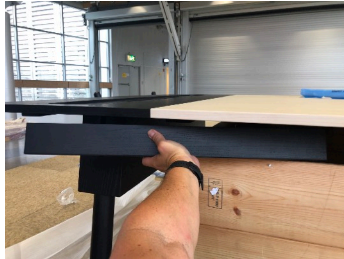
MONTERA SIDOBALKARNA MELLAN SIDOSKIVOR OCH MITTENPARTIET