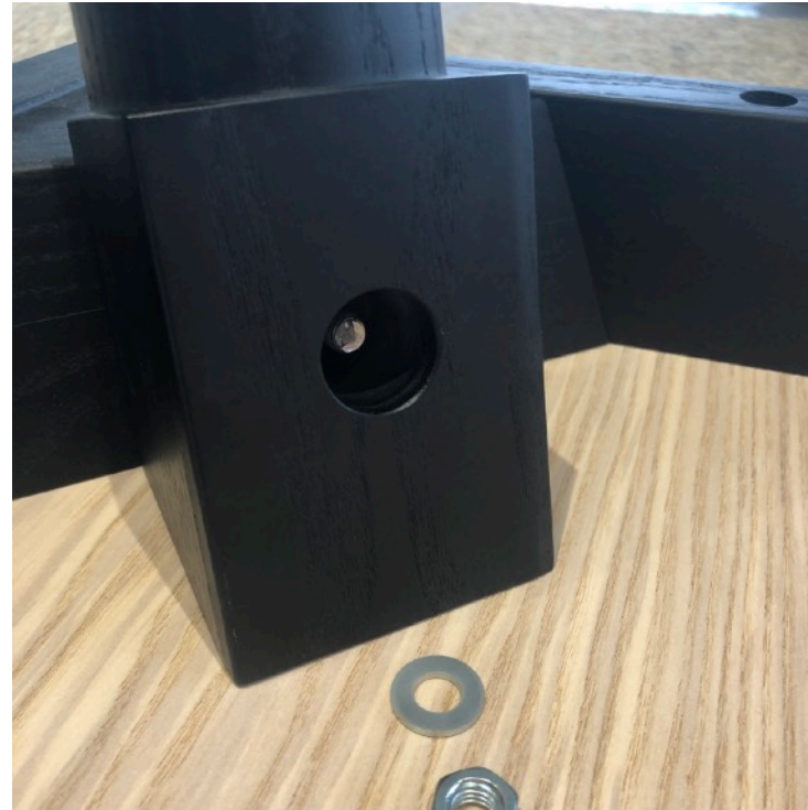
TRÄ PÅ BEN I VARJE GAVEL PÅ SIDOSKIVORNA. SEDAN BRICKA & SEDAN MUTTER